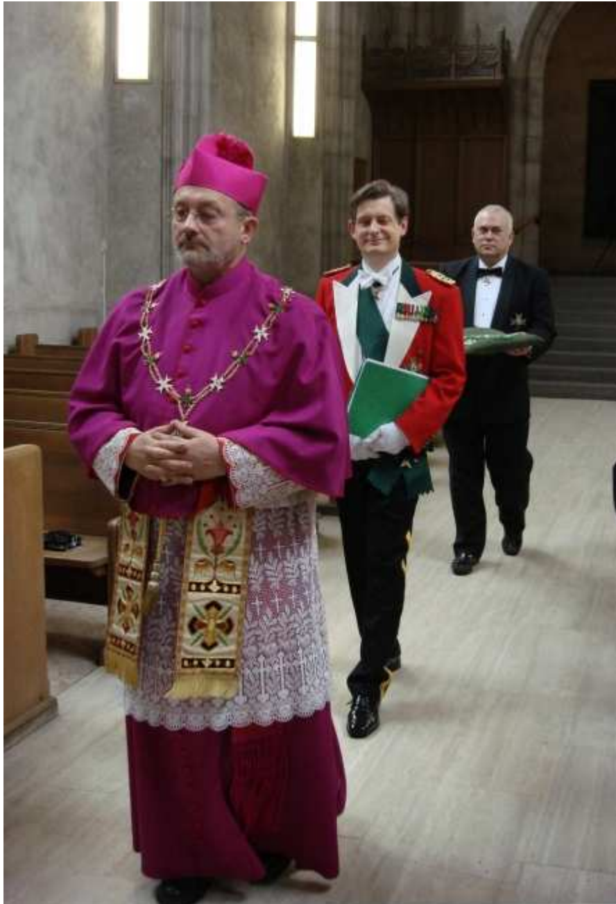
Einholung des Großmeisters und der Insignien des Großmeisters.