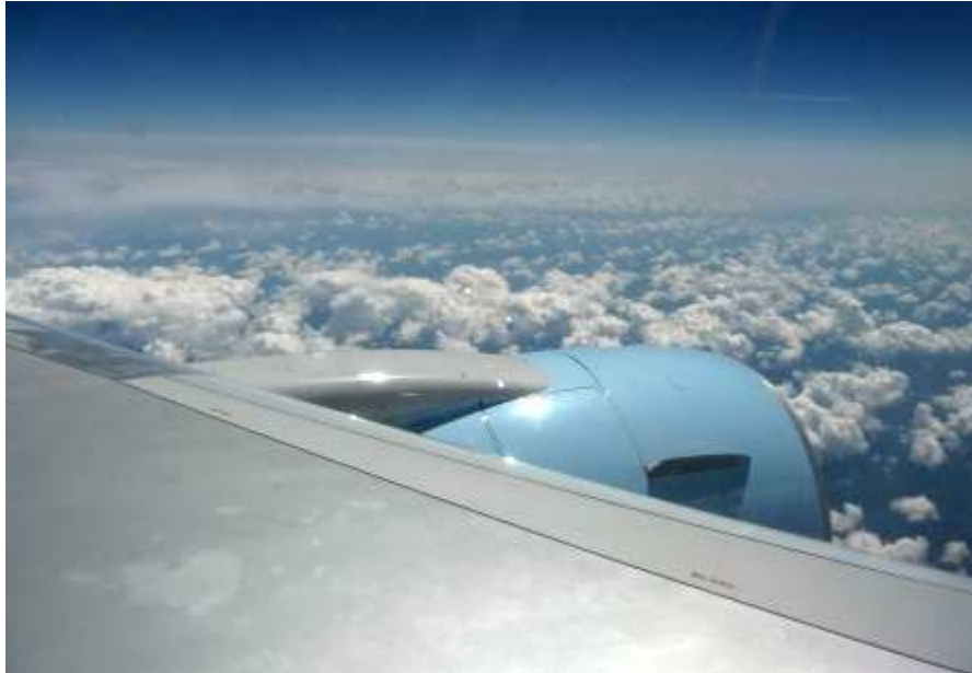
Auf dem Flug nach Toronto

(Toronto/Kanada: Ein Bericht über die Einführung des neuen Großmeisters in sein Amt durch S.E. Erzbischof Douglas Titus Lewins aus London am 20. Juni 2009.)