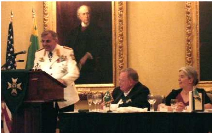
CSLI Bundeskommandant Senator h.c. Wolfgang Steinhardt bei seiner Laudatio für den Großmeister.