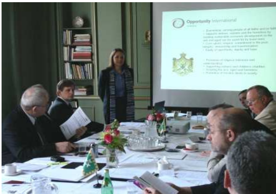
Karitative Projekte des Ordens werden vorgestellt und besprochen.

Die wichtigsten Punkte dieser Vereinbarungen betreffen die Kooperation und die Unterstützung des CSLI für internationale Hilfsprojekte des St.Joachim Ordens.