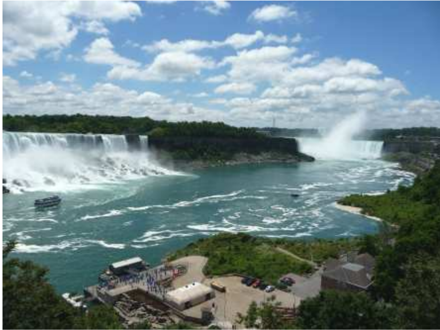
Das beeindruckende Panorama der Niagarafälle (Links der "AMERIKANISCHE" und rechts der "KANADISCHE").

An dieser Stelle noch Dank und Hochachtung an alle im „Hintergrund“ arbeitenden Ordensmitglieder des St.Joachim Ordens, die diese erlebnisreichen und freundschaftlichen Tage für alle Beteiligten organisiert und ermöglicht haben. Es ist für das CSLI eine (schöne) Verpflichtung, auch bei den nächsten Veranstaltungen (Z.B: Investitur in London am 7. November 2009) wieder präsent zu sein.