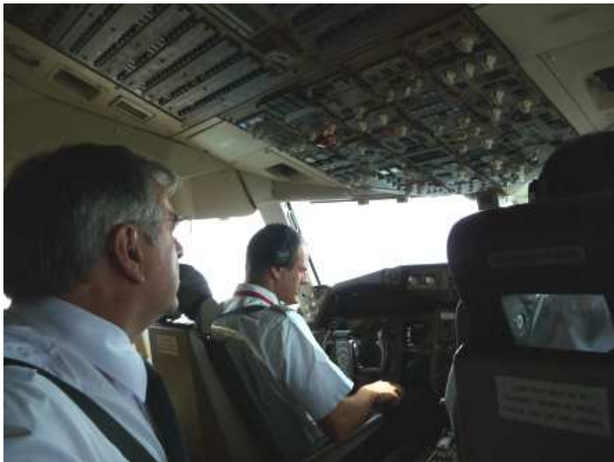
Unser Bundeskommandant (Als ehemaliger Fluglehrer der Austrian Airlines Verkehrspilotenschule ÖLS in Graz fast ein "MUSS") im Cockpit der AUA Maschine B-767 von Flug OS 071 von Wien nach Toronto.