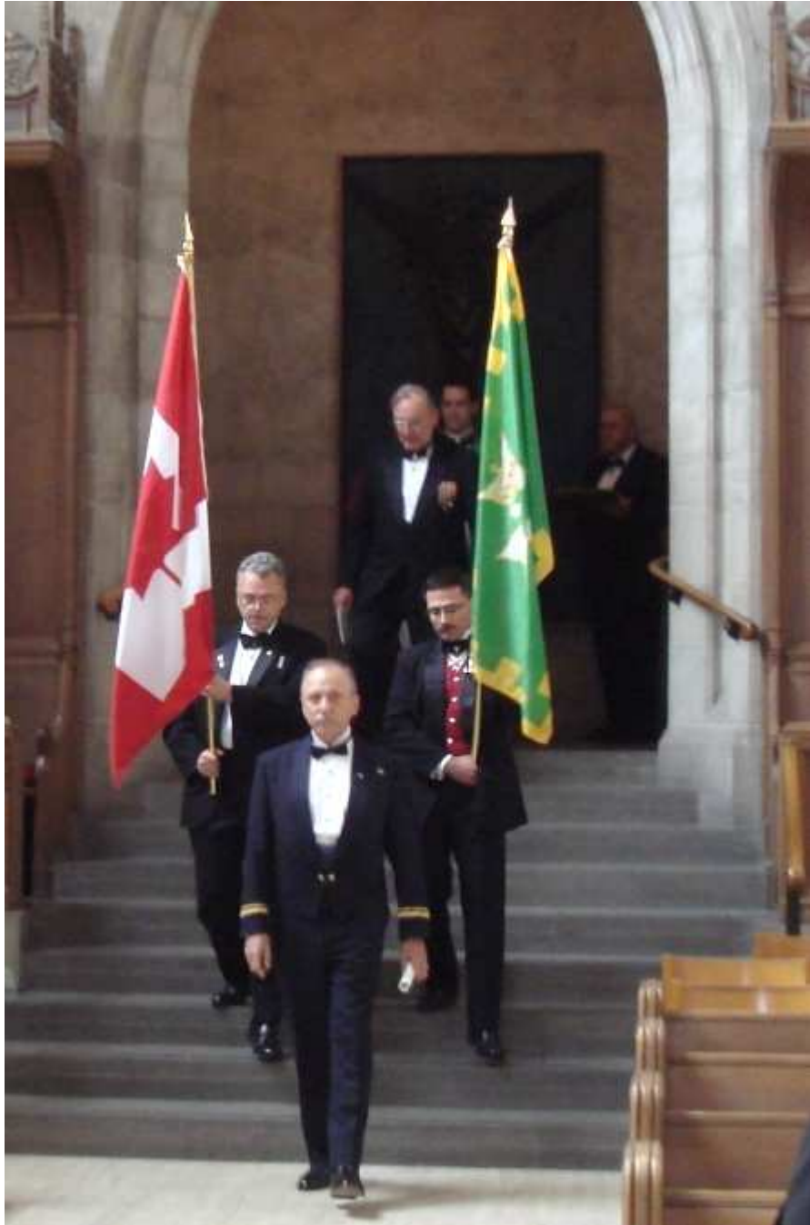
Einzug der Fahnen