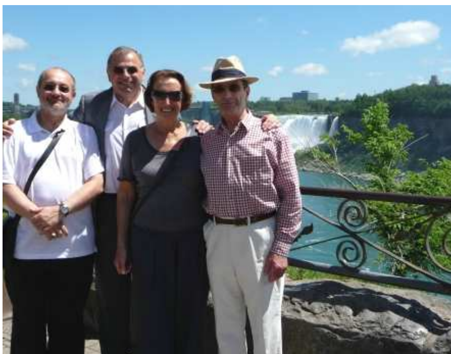
Ein Teil der fröhlichen Ausflügler vor dem "amerikanischen" Niagarafall im Hintergrund.

Am 22. Juni wurde von der „Canadian Commandery des St. Joachim Ordens“ noch ein wunderbarer Ausflug zu den Niagarafällen organisiert, welcher gelöst und kameradschaftlicher Atmosphäre stattfand und von allen Teilnehmern sichtlich genossen wurde.