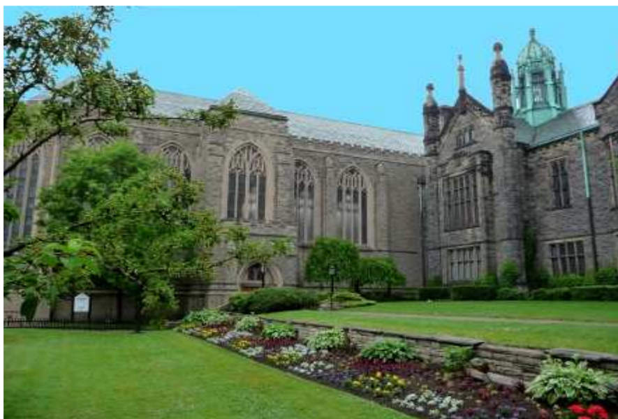
Die "Trinity College Chapel" wo die Investitur stattfand.