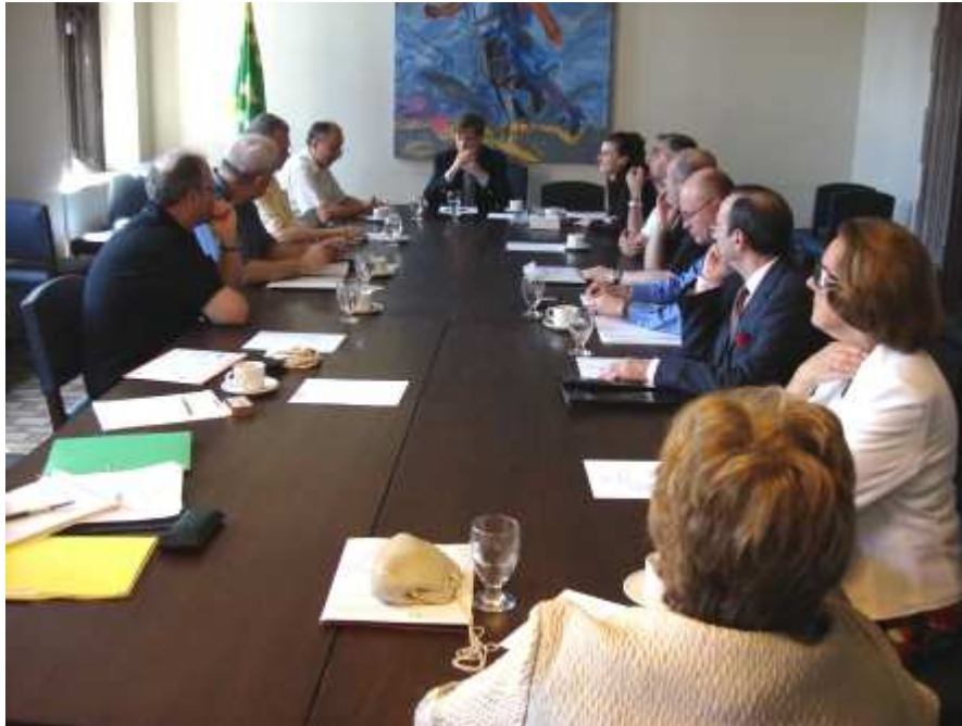
Im "Hart House" der Universität von Toronto fand das abschließende Generalkapitel statt.

Diese unvergesslichen Tage fanden am 21. Juni 2009 durch das Generalkapitel im „Hart House“ der Universität von Toronto einen würdigen Abschluss.