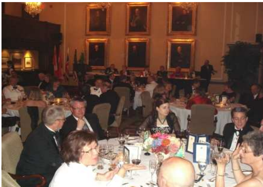
Das Galadinner im noblen "National Club Toronto".