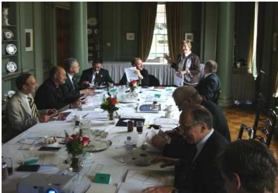
Kapitelsitzung: Vortrag der Kapitelmitglieder zu bestimmten Themen

Die wichtigsten Punkte dieser Vereinbarungen betreffen die Kooperation und die Unterstützung des CSLI für internationale Hilfsprojekte des St.Joachim Ordens.