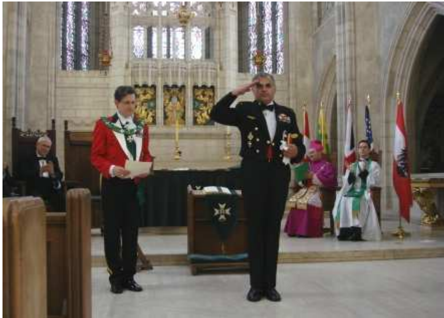
Der neuernannte "Commander" grüßt respektvoll das Großkapitel und die anwesenden Festgäste.